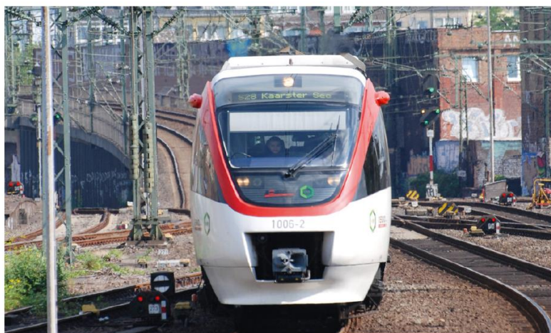
Regiobahn erhält sehr gute Noten von den Fahrgästen.

Wie zufrieden sind Sie mit der Pünktlichkeit? Wie freundlich sind die Servicemitarbeiter? Wie oft ist der Fahrkartenautomat defekt? Solche und ähnliche Fragen werden bei rund 300 Befragungen im Rahmen der Kundenzufriedenheitsmessung durch geschultes Personal des Verkehrsverbundes Rhein-Ruhr AÖR gestellt und von den Fahrgästen im Schienenpersonennahverkehr (SPNV) beantwortet. Darüber hinaus wird jedes Eisenbahnverkehrsunternehmen im VRR von Profi-Testern des Verkehrsverbundes mindestens 140 Mal pro Jahr kontrolliert. Nun hat der VRR den Qualitätsbericht 2015 vorgelegt und die Regiobahn S28 steht laut diesem Bericht glänzend da und erzielte dabei ein noch besseres Ergebnis als in den Vorjahren.